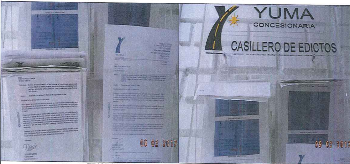
EDICTOS DE LA P_02593 y R_16080 YC-CRT-50335